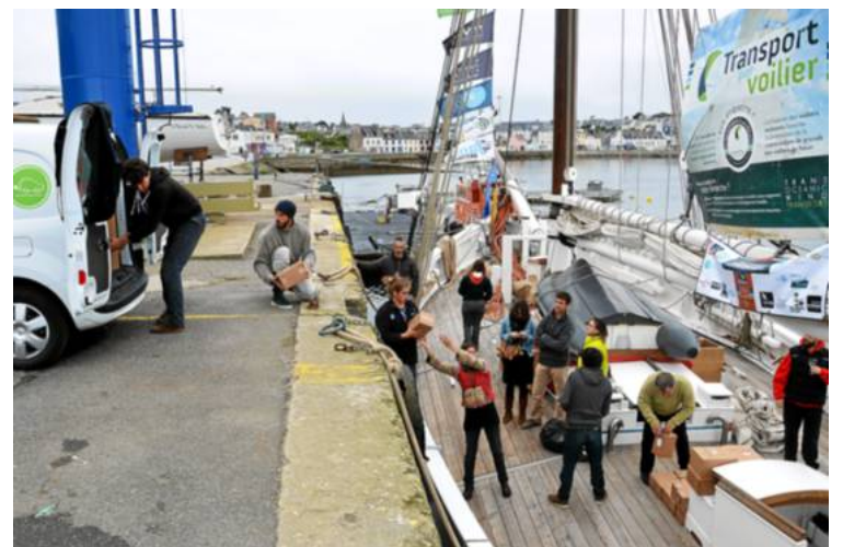
Quai Téphany, déchargement d'une tonne de marchandises du « Biche », vendredi, par TOWT, entreprise basée à Brest, qui développe « un modèle de transport alternatif, strictement à la voile ».

« L'intérêt de transporter à la voile est de différencier le produit et de valoriser son transport, alors que, la plupart du temps, ses phases d'acheminement restent parfaitement invisibles, marginales. À la voile, le transport prend de la valeur ajoutée. De plus en plus de sociétés nous contactent pour acheminer leur produit. Elles cherchent à valoriser ce moment, les valeurs